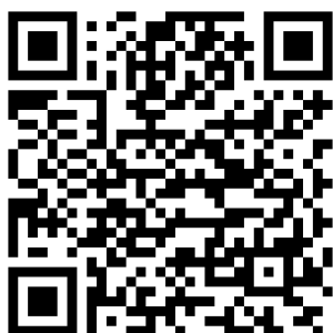
Qr-код для Google Play